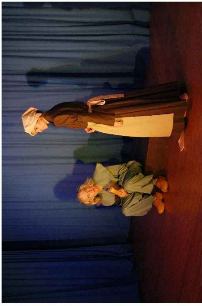
Compagnie Pegasus, "vom Fischer und seiner Frau", Grimm info@compagniepegasus.net